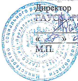
График заездов в государственное автономное учреждение социального обслуживания Оренбургской области «Реабилитационный центр «Проталинка» 2020 год (г. Оренбург, пр. Гагарина, д. 43а)